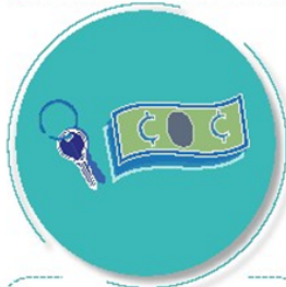
Después de tocar dinero o llaves