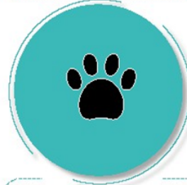
Después de estar con mascotas