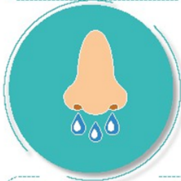
Después de toser o estornudar