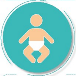
Antes y después de cambiar pañales