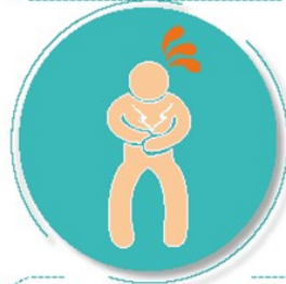
Después de visitar o atender una persona enferma