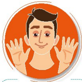
Antes de tocarse la cara