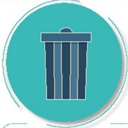
Después de tirar la basura