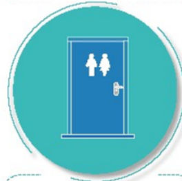
Después de tocar pasamanos o manijas de puertas