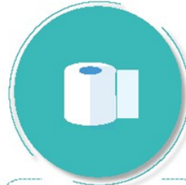
Después de ir al baño