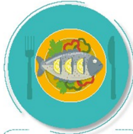
Antes de preparar y comer los alimentos