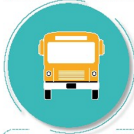
Después de utilizar el transporte público